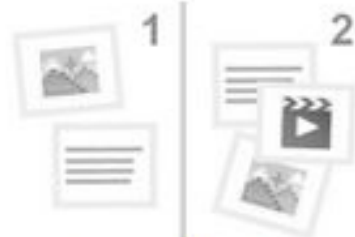
Der, die, das? 2.