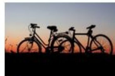
Possessivpronomen (1.- 3. Person Plural -