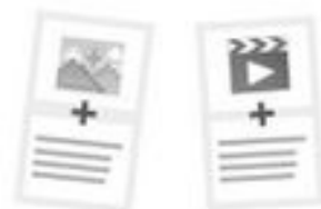
Hit 1_L_3_Fragen hören und richtige