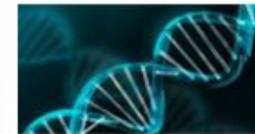
Begründung von Vererbungsmustern