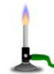
Arbeitsgeräte eines Chemikers